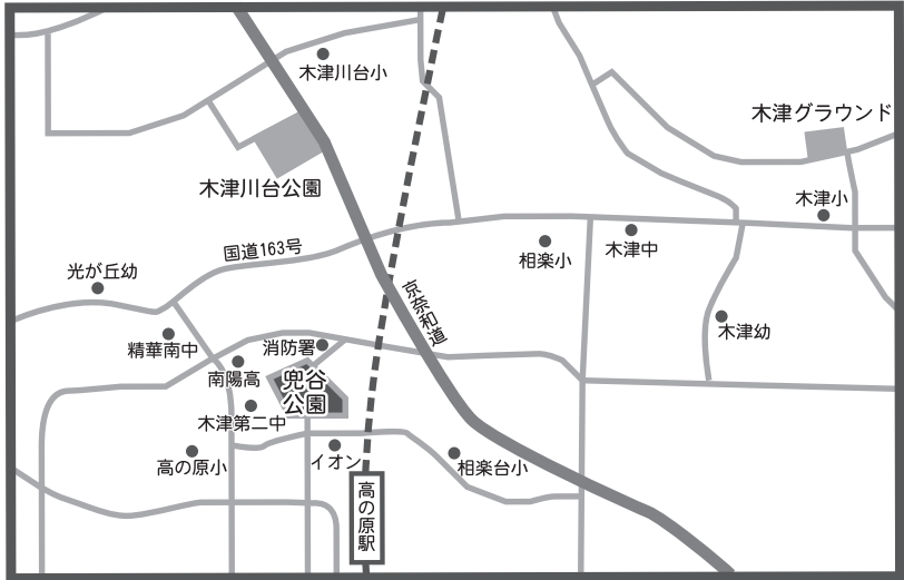
A detailed map of the area around Takinaka Station (高の原駅). The map shows a network of roads, including National Route 163 (国道163号) and the Takinaka River (砥谷川). Key locations marked include: 高の原駅 (Takinaka Station) at the bottom center, indicated by a train icon. 公園 (Park) located near the station, with a shaded area representing the park grounds. 消防署 (Fire Station) located to the north of the park. 学校 (Schools) marked with dots: 光が丘幼 (Mitsugakayama Kindergarten), 精華南中 (Seikwa Junior High), 南陽高 (Nanyo High), 木津第二中 (Kitsunaka Second Junior High), 高の原小 (Takagahara Elementary), イオン (Aeon), 相楽小 (Sagara Elementary), 相楽小 (Sagara Elementary), 木津中 (Kitsunaka Junior High), 木津小 (Kitsunaka Elementary), 木津幼 (Kitsunaka Kindergarten), 木津川台小 (Kitsunakatai Elementary), and 木津グラウンド (Kitsunaka Ground). 木津川台公園 (Kitsunakatai Park) located to the north of the station. 砥谷川 (Takinaka River) flowing through the area, marked with a dashed line.

※お休みされる場合は12月中であれば鴻ノ池外周教室等へ振替えてご参加いただくことも可能ですので、コーチまでお声がけ下さい。