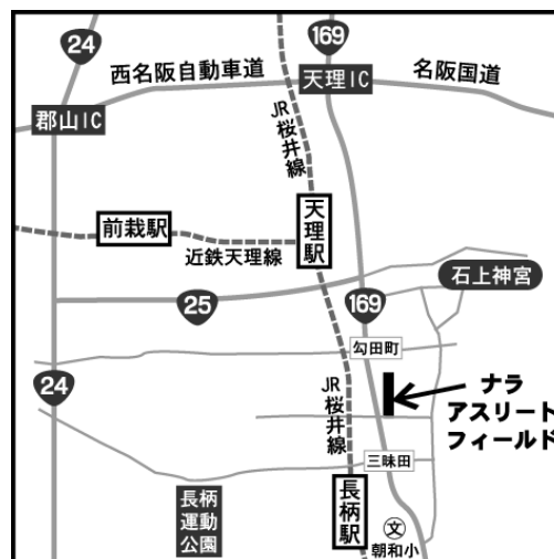
ナラアスリートフィールド周辺図

※お車によるトラブル等の責任は負いかねますので、事故等が発生しないように十分ご注意をお願い致します。